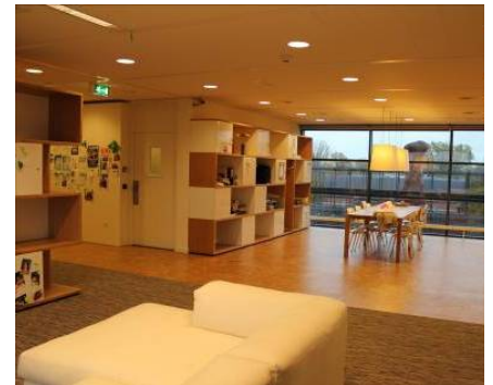
Figuren 4.4: sfeerimpressie van het gebouw van de B/SCD