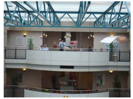
Figuren 4.3: Sfeerimpressie van het gebouw van Achmea