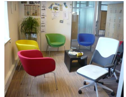
Figuren 4.2: Sfeerimpressie van het gebouw van de Belastingdienst Leiden

In het onderzoek zijn vanuit de observaties en interviews succesfactoren benoemd voor het ontmoeten op kantoor en specifiek voor het gebruik van de coffee-corner: