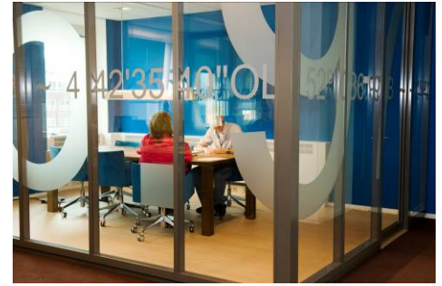
Figuren 4.1: Sfeerimpressie van het gebouw van de Douane in Rotterdam

Uit de observaties blijkt dat ontmoeten niet alleen een aangelegenheid is die zich afspeelt in de coffee-corners. Ontmoetingen vinden op allerlei plekken plaats. Ze ontstaan in de gang als men elkaar tegenkomt of ze ontstaan terwijl iemand staat te wachten bij een printer of koffieautomaat. Ook ontstaan veel gesprekken aan de werkplekken. Dit ontstaat bijvoorbeeld doordat mensen een collega zien zitten en even blijven praten, of doordat mensen een gesprek beginnen met een collega die dichtbij zit.