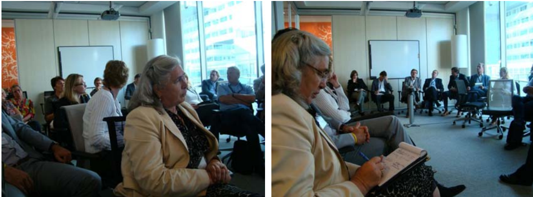
Andere opstelling, andere dynamiek?