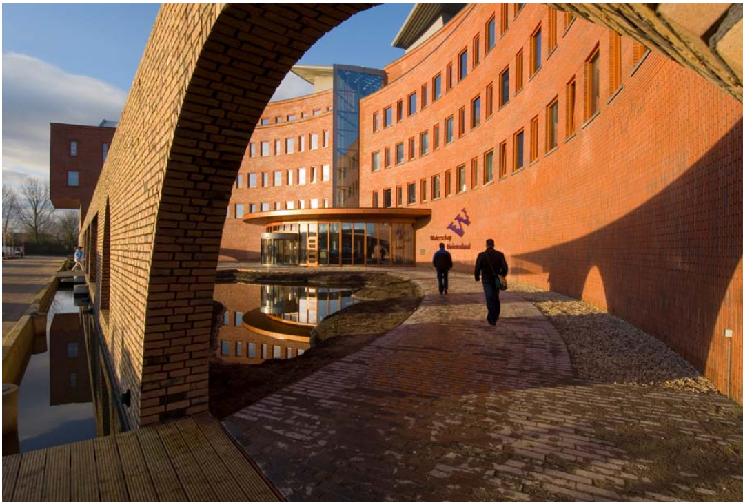
Entree Waterschap Rivierenland

De projectgroep nieuwbouw hield zich bezig met de ‘hardware’ (= het gebouw). De projectgroep Habit@ hield zich specifiek bezig met de ‘software’ (= het kantoorconcept en de bewustwording van het personeel). In de projectgroep Habit@ zaten o.a. de afdelingshoofden I&A en FZ. Er is voor gekozen het lijnmanagement verantwoordelijk te laten zijn voor de nodige zaken rond I&A en FZ. Deze verantwoordelijkheid werd niet overgedragen aan de projectgroep. Men kon zich als managers dus niet verschuilen. Daarnaast was ook P&O vertegenwoordigd in de projectgroep Habit@ vanwege het opleidingstraject dat is opgezet om medewerkers te ondersteunen bij het overgaan op de nieuwe manier van werken, en om te kijken of er raakvlakken waren tussen de nieuwe omgangsnormen en de kerncompetenties.